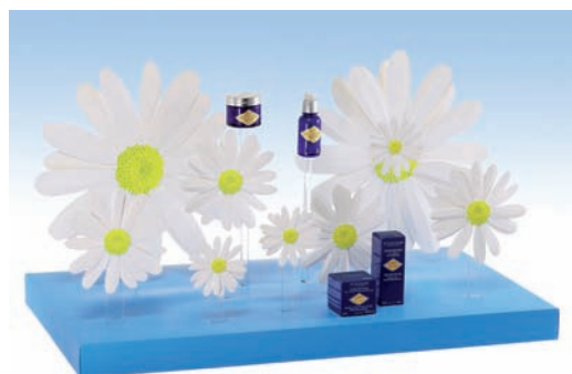
L'Occitane POPAI Winner - Window Display