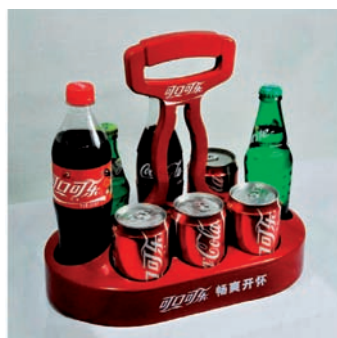
Mass market - Asia FMCG, foldable Drinks Carrier & Straw Dispenser, by GESA Shanghai

Merchandising: Ein weiterer Teil des Portfolios von GESA ist ein maßgeschneidertes Merchandising Konzept, welches auf Anfrage für den jeweiligen Kunden ausgearbeitet und durchgeführt wird.