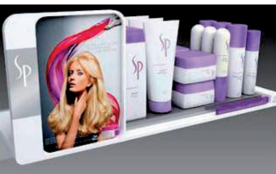
Premium Shelf Display

GESA betreibt, neben dem Standort in Dreieich, komplett ausgestattete Designservice- und Produktionsanlagen in Shanghai und verfügt über Spezialisten in Paris und London.