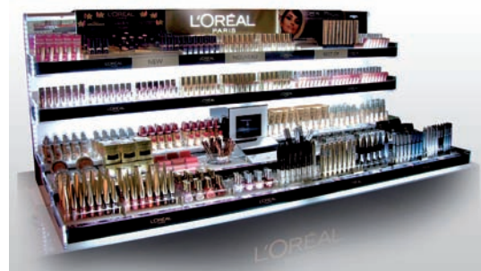
Bergerie Cosmetic Table Unit