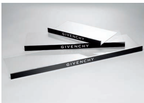
Givenchy POPAI Winner - Shelf Dresser

Unter Berücksichtigung von Umweltschutzaspekten wie zum Beispiel der Verwendung von Restwärme aus dem Herstellungsprozess, der Nutzung von Regenwasser und dem Einsatz von Photovoltaik wird dem Ziel der Nachhaltigkeit eindrucksvoll Rechnung getragen. GESA rüstet sich für eine dynamische Wachstumsphase, in der sich das Unternehmen als Vorreiter in Sachen Qualität, Wettbewerbsfähigkeit und Nachhaltigkeit erweisen wird.