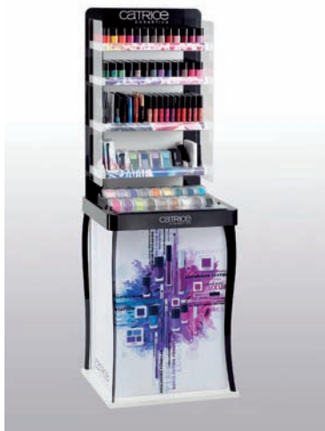
Catrice POPAI Winner - Floor Stand

Das GESA Portfolio beinhaltet die aktive Ausstattung von Luxus-, Massenmarkt-, Flagship- und Konzeptläden.