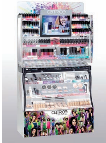
Catrice POPAI Winner - Beauty Shop

GESA definiert die Grenzen von Innovation und Design immer wieder neu. Die POPAI-Awards werden alljährlich für hervorragende Leistungen im Bereich Kreation von POS-Materialien verliehen. Die dynamische und kreative Teamarbeit zwischen GESA